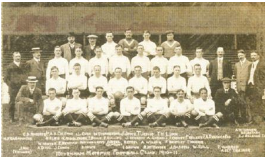
Walter Tull bij Tottenham Hotspur.

Walter was een uitstekend voetballer en kon aansluiten bij Tottenham Hotspur ! Hij mocht meteen op tournee naar Zuid-Amerika en maakte zijn debuut bij het A-team in wedstrijden in Argentinië en Uruguay! Zijn eerste leaguedwedstrijd speelde Walter Tull tegen Manchester United ! Hij toonde meteen zijn kwaliteiten en had alles om een grootse carrière uit te bouwen.